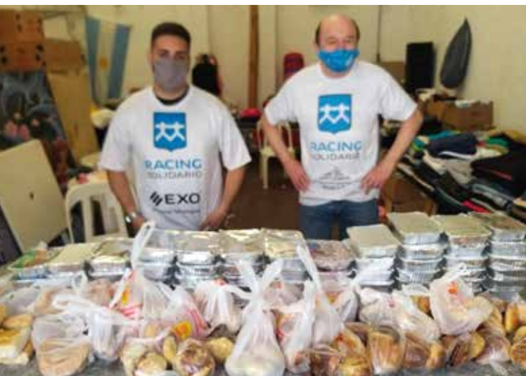
Continuo reparto de viandas en barrios humildes. ▲

Como es habitual, Racing Solidario continuó dando asistencia a una decena de barrios, entre ellos Nueva