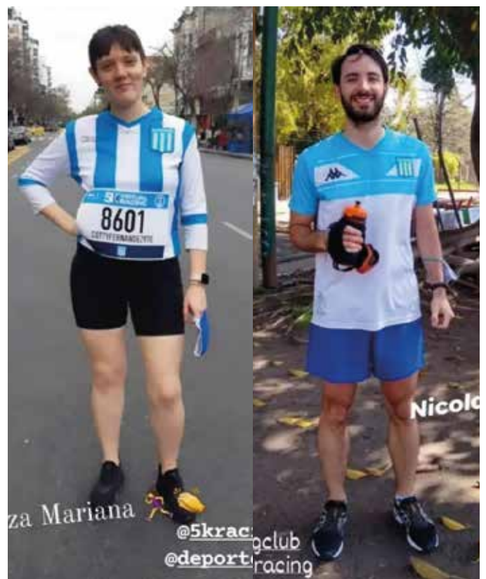
Participantes de la 9ª edición de la 5k de Racing Club ▼

Con la incorporación de un Community Manager, desde agosto de 2021 se ha logrado una eficaz administración de las distintas redes del departamento (Facebook, Twitter e Instagram), lo que ha posibilitado una mejor comunicación y difusión de los distintos deportes del club, lo cual se ve reflejado al compararse las métricas que arrojaron las mismas en los meses de julio, agosto y septiembre: en el total de las tres cuentas se incrementaron los seguidores en 403 y las publicaciones en 739. Y al haberse comenzado de manera formal y frecuente la interacción con la cuenta oficial de Racing Club, mediante reposteos y publicación de notas de las actividades en la web oficial, se consiguió un efecto multiplicador.