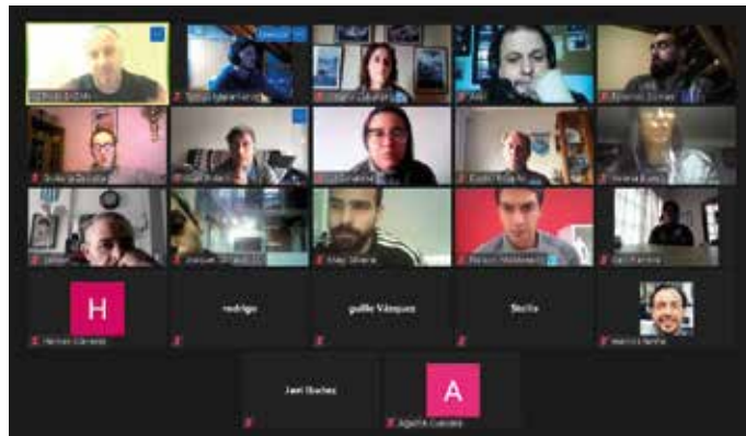
Curso de RCP y DEA. ▲

Se realizó un programa de capacitación de clubes