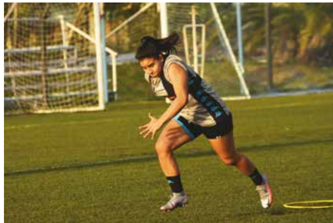
Entrenamiento en el predio Tita Mattiussi. ▲

Racing dispone además de ocho lugares para jugadoras del interior o del extranjero distribuidos en tres departamentos alquilados por la institución (uno, en el centro de Avellaneda; y los otros, a una cuadra