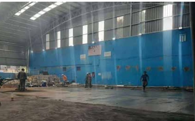
Obras en Villa del Parque. ▲

El salón de uso múltiples y de tango también recibieron mejoras, con colocación de puerta de blindex, pintura y ploteo. En el sector de oficinas hubo cambio de mobiliario y en el buffet se procedió a reemplazo de caños en las cámaras de distribución. También se instaló una rampa para personas con