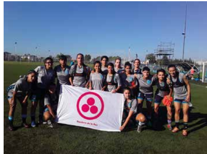
Presentación de la Bandera de la Paz. ▲

Cambio Social, Universidad The Global Institute of Sport England, entre otras.