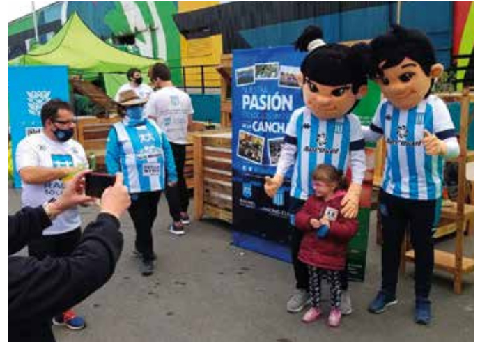
Feria del Fútbol en Avellaneda. ▼