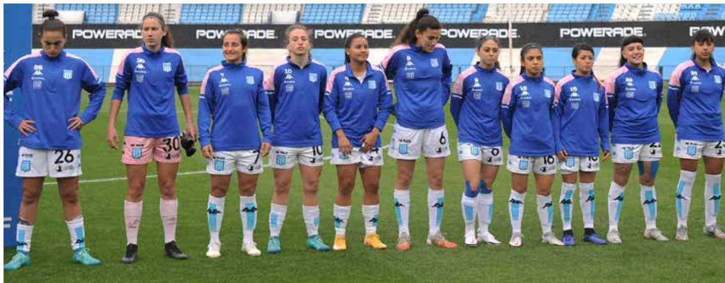
RealCup como sponsor presente en la indumentaria. ▲

En relación a la indumentaria y a los materiales, la actividad cuenta con un espacio propio de utilería en el Predio que comparte con Infantiles y con un espacio propio en el depósito de Locademia en el estadio. La Primera División utiliza dos modelos de camiseta oficial Kappa con un diseño exclusivo. Cada jugadora tiene su camiseta individualizada, con el nombre y el número elegido. Por otro lado, posee también ropa de entrenamiento diseñada especialmente para el fútbol femenino, con la correspondiente difusión y comercialización a cargo de Locademia.