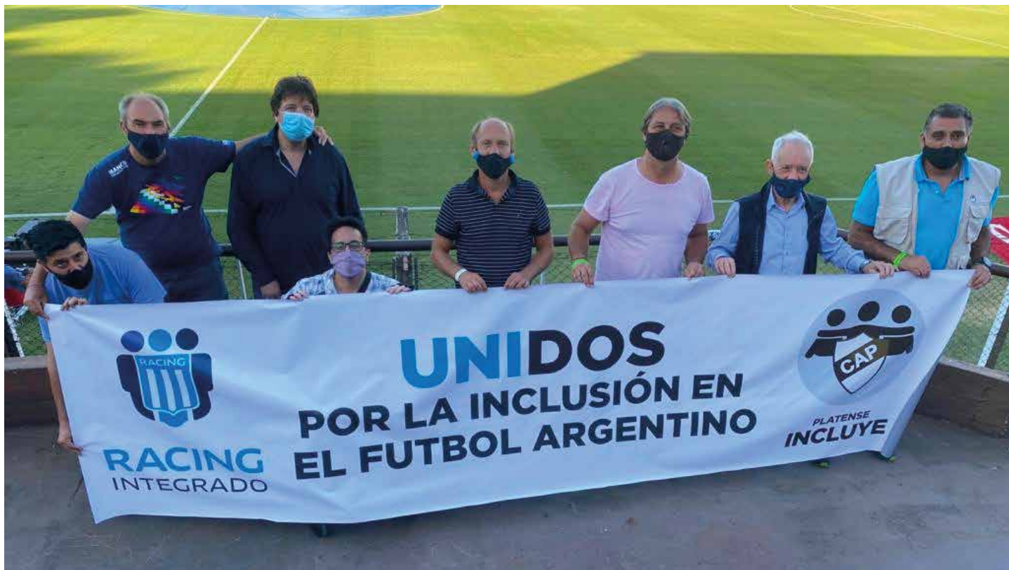
Campaña "Unidos por la inclusión en el fútbol argentino." ▲

estadios), Federación Metropolitana de Taekwondo, Ministro de Deportes de Chile y Jugadores de Inferiores de Racing Club.