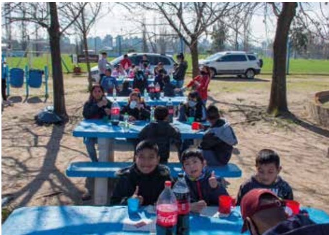
Día de las Infancias en el Tita y el Cilindro. ▼

Se realizaron dos eventos para el Día de la Niñez en el Predio Tita Mattiussi, donde concurrieron más de 200 chicos y chicas, que disfrutaron de espacios recreativos con mega inflables, fútbol recreativo y shows, además de un refrigerio al mediodía y una merienda a la tarde. Cada uno de los y las participantes se llevó juguetes y una bolsa repleta de golosinas.