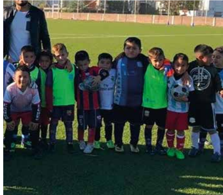
Las pruebas de jugadores y captación volvieron al Tita. ▲

Nuestro objetivo es proteger y mejorar la salud de todos los que practican este deporte, desde el fútbol base hasta la elite. Nuestro compromiso es realizar una tarea preventiva en busca de limitar lesiones en el