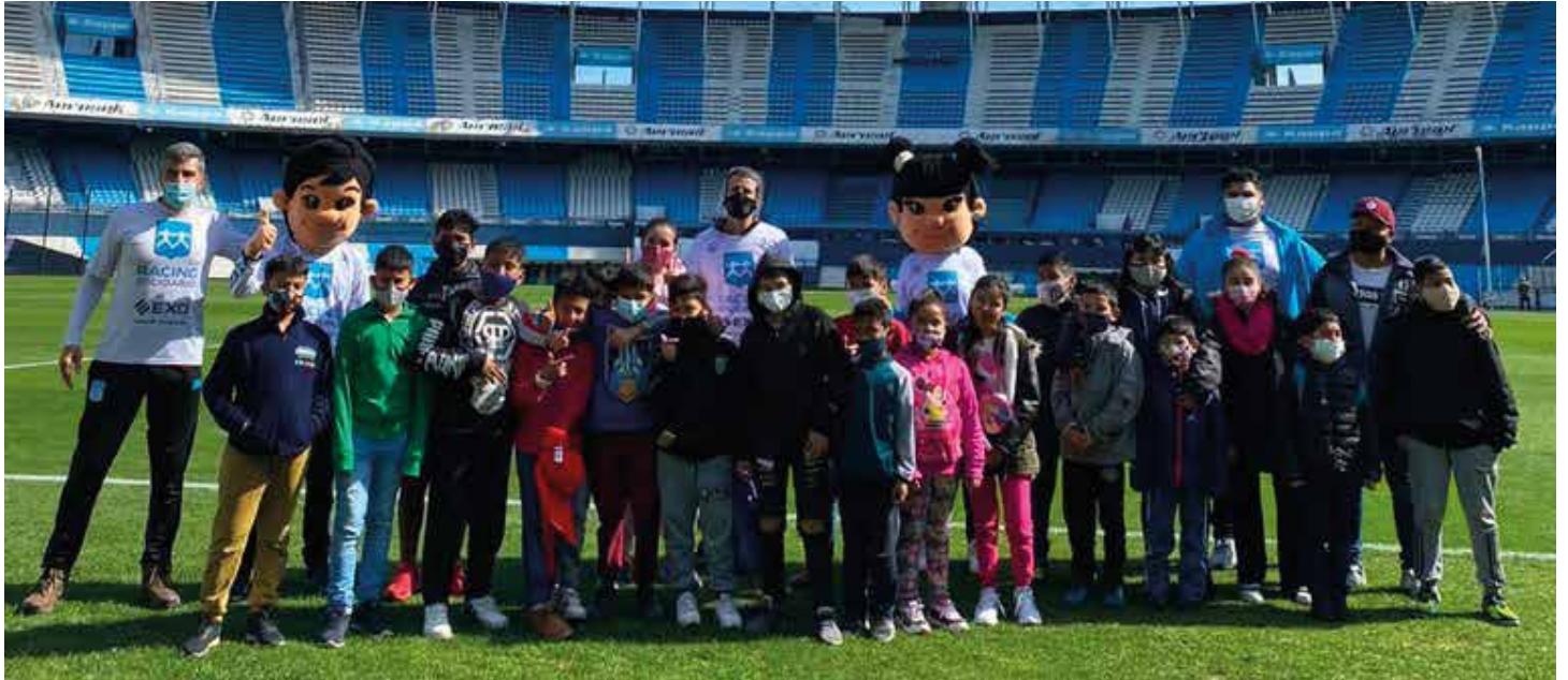
Visitas de los más chicos en el Día de las Infancias. ▲