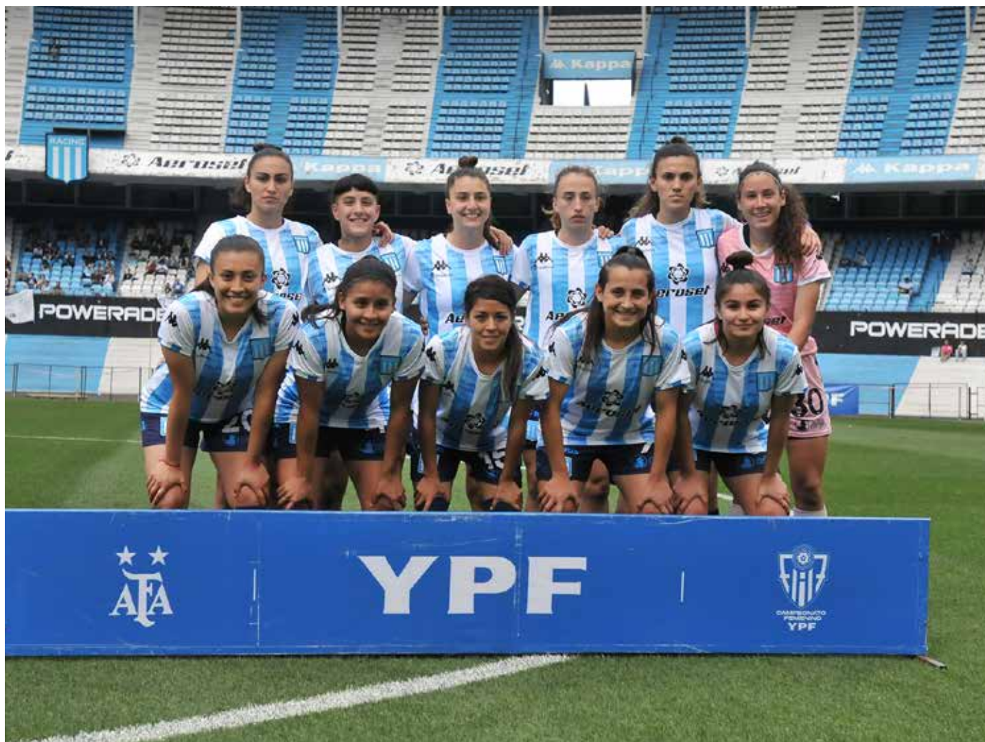
Plantel de Fútbol Femenino en el Cilindro. ▼