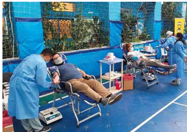
Campaña de donación de sangre. ▲

Realizamos, también tres campañas de donación de sangre con más de 120 dadores. Dos de ellas fueron